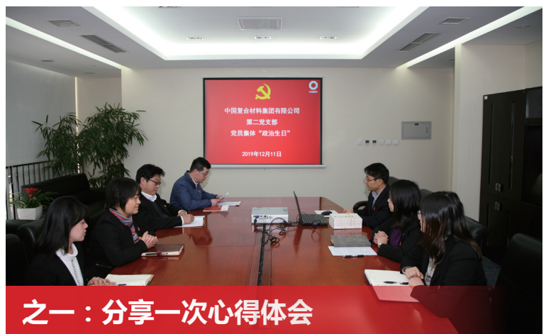
之一：分享一次心得体会